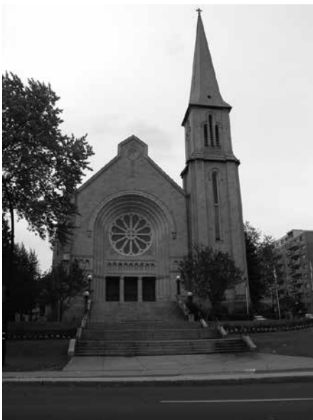
Côte-Sainte-Catherine, l'église Saint-Germain d'Outremont (photo). La